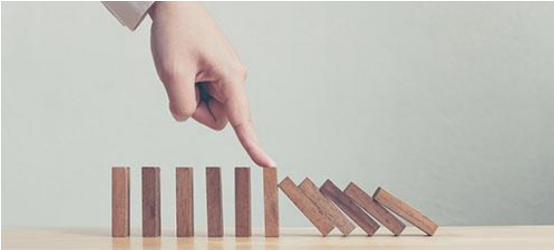
Abbildung: Domino-Effekt