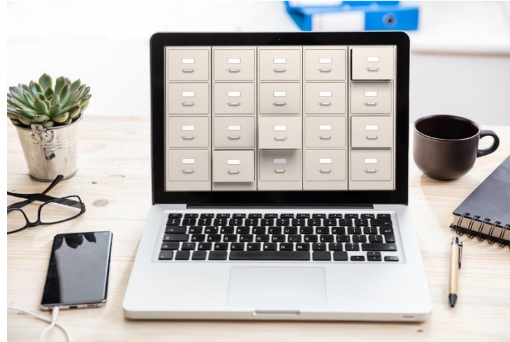
Abbildung: Ordnung