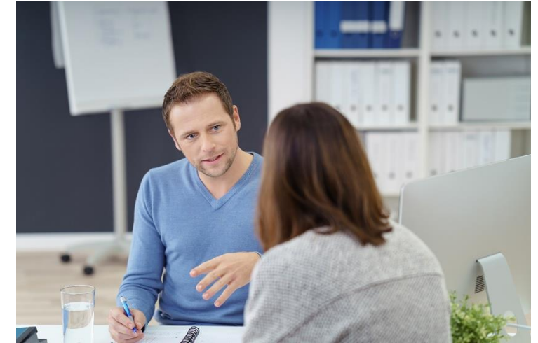
Abbildung: Kundengespräch