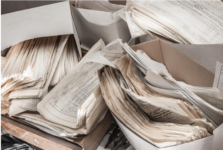
Abbildung: Chaos